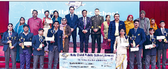
रेवाड़ी। विद्यार्थियों को छत्रवृत्ति प्रदान करते हुए, सांस्कृतिक कार्यक्रम पेश करते विद्यार्थी।