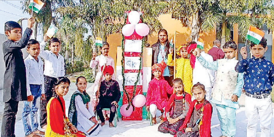
रेवाड़ी। वीर बाल दिवस मनाते विद्यार्थी।