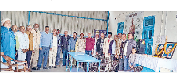
रेवाड़ी। सरदार उधम सिंह को श्रद्धांजलि अर्पित करते हुए।