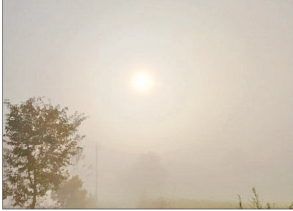
रेवाड़ी। मंगलवार सुबह कोहरे को चीरकर उदय होता उदय होता सूर्य, बणीपुर चौक के पास पविसडेट में क्षतिग्रस्त थार गाड़ी।

लगातार दूसरे दिन भी सुबह और शाम के समय कोहरा छाया रहा। विजोबिलिटी कम होने के कारण कई स्थानों पर वाहन दुर्घटनाग्रस्त हुए। इन हादसों में पांच लोगों की मौत हुई, जबकि महिला सहित पांच लोग घायल हो गए। कई स्थानों पर कोहरे की दृश्यता 20 मीटर से भी कम रही। गत सोमवार को सुबह के समय घना कोहरा छाने से कई सड़क हादसे हुए थे। इनमें एक दुकानदार की मौत हो गई थी। मंगलवार को दूसरे दिन भी कोहरे का प्रकोप बना रहा। सुबह 8 बजे तक कई इलाकों में घना कोहरा छाया रहा। साबी नदी पुल के पास पिकअप पेड़ से टकराने से चार लोग घायल हो गए, जबकि दिल्ली रोड पर कार दुर्घटनाग्रस्त होने से