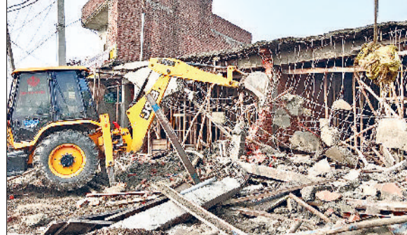
इंदी। गांव मटकमाजरी के पास बन रहे निर्माणाधीन शोरूमो पर चलता पीला पंजा।

हरिभूमि न्यूज। अंबाला कर्ज में डूबी बनौदी शुगर मिल को अटैच करने के आदेश जारी हो चुके हैं। अदालत के इन आदेशों के बाद वे किसान परेशान हैं जिसका करोड़ों रुपये का भुगतान मिल की ओर बकाया है। ऐसे में अब किसान मिल को अटैच करने के विरोध की तैयारी कर रही हैं। किसान युनियनों ने बुधवार को एसडीएम