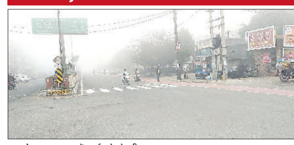
कुरुक्षेत्र। आसमान में छाई कोहरे की चादर।