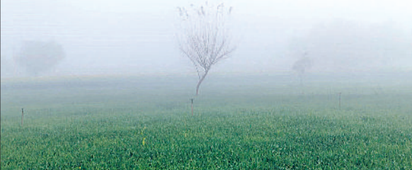
रेवाड़ी। मंगलवार सुबह एक खेत में गेहूँ की फसल पर छाया कोहरा।

अभी कोई संभावना नहीं है। गत वर्ष 26 दिसंबर को अधिकतम तापमान 10.5 डिग्री और न्यूनतम 2.5 डिग्री सेल्सियस दर्ज किया गया था। दोनों तापमान कम होने के कारण कड़ाके की ठंड कंपकंपाने लगी थी। उसकी तुलना में इस बार अधिकतम तापमान सीजन में एक बार भी 21 डिग्री सेल्सियस से कम नहीं हुआ, जबकि न्यूनतम तापमान एक बार 4.5 डिग्री सेल्सियस पर पहुंचने के बाद बढ़ना शुरू हो गया। मंगलवार को अधिकतम तापमान 0.3 डिग्री