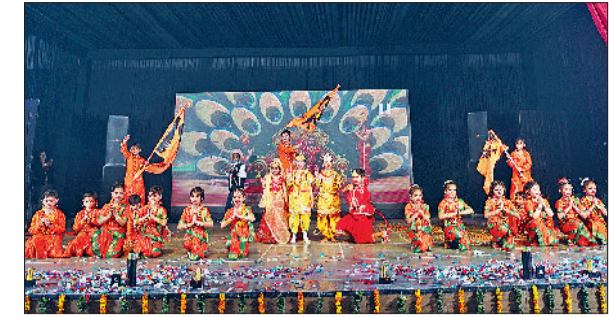
रेवाड़ी। कार्यक्रम में प्रस्तुति देते हुए बच्चे।