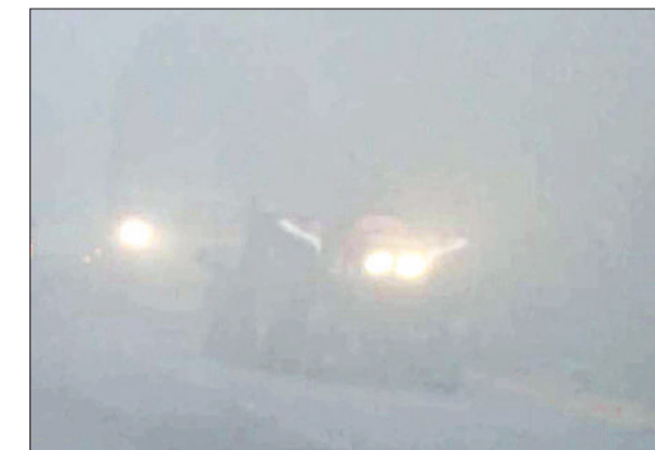
यमुनानगर। मंगलवार को सुबह के वक्त घने कोहरे के बीच सड़कों पर रंगते वाहन।