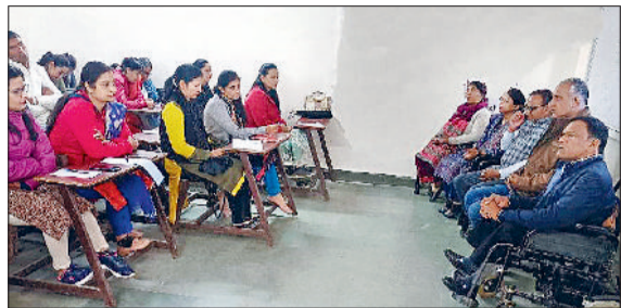
रेवाड़ी। बीआरपी व एबीआरसी को जानकारी देते डाइट प्राचार्य।

इस अवसर पर डाइट प्राचार्य ने कहा कि यौन अपराधों से बच्चों का संरक्षण अधिनियम का उद्देश्य